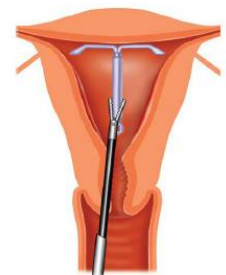
Het verwijderen van een spiraaltje